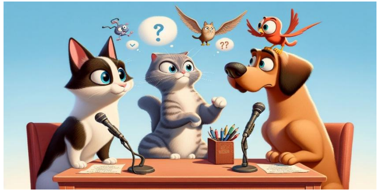
A humorous Pixar-style image of cats and dogs in a debate, showcasing their intelligence without any signs of conflict by DALL·E 3

Inteligencia Más Allá de los Humanos. ¿Es la especie humana la única con inteligencia? ¿Cuáles otras especies muestran inteligencia? Las personas que amamos a los gatos y a los perros inmediatamente tomaremos partido que las mascotas suelen ser más inteligentes que sus compañeros humanos. Al menos, hasta el momento, no se sabe de guerras entre gatos o perros.