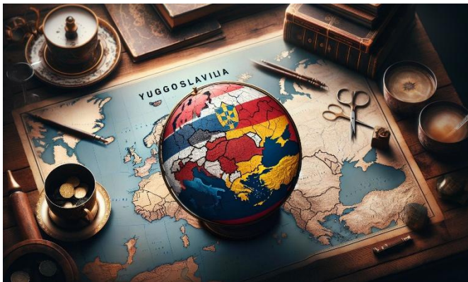
An image representing the concept that Yugoslavia no longer exists, showing a map with the new countries that emerged after its dissolution by DALL-E 3. Nótese sin embargo el error en el texto del mapa no dice exactamente YUGOSLAVIA.

La ‘inteligencia’ es un término que usamos con frecuencia para calificar a las personas en un espectro de “más o menos inteligente”. Permítame estimado lector algunas anécdotas personales: