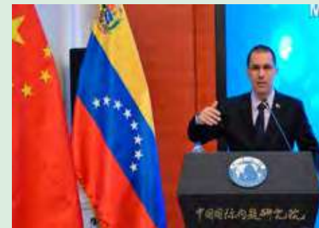
Canciller expone en China la realidad política de Venezuela / 2