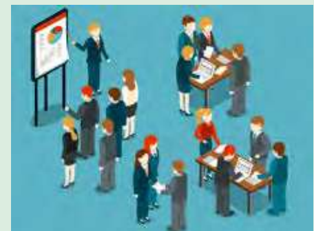
Pasos para realizar tus registros en Petros / 3